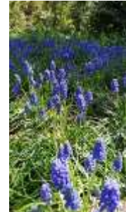
春を待って咲くムスカリ

かえで保育園の栽培は春になったら花を育てる・野菜の苗を植えるという栽培ではありません。種に興味を持つ子は種コレクションから園庭の様々なところに種の植え付けをしていきます。水につけたり、皮をむいたりしながらどうすると芽が出るかを自ら体験の中で「こうしたい」「こうすればいいんだ」と納得して進めていきます。大人が用意した実のなる植物の実が育ち食べるということではなく、子どもがやりたくて果物や野菜などの種や実の様々な不思議に興味を持ち、自ら育てたいという気持ちが芽生えます。発芽して芽が伸びて育っていく様子を毎日嬉しそうに見ていきます。そしてやがてしっかり根付いていたり、葉っぱの変化を観察したりしながら様々な事象やいろんな違いに気づきます。時にはうまくいかずがっかりしたり、植える時期とお世話がうまくいくとどンドン成長し、収穫まで持っていけるとうれしく達成感を味わえます。今年の幼児クラスは「育てたい」と思うものがたくさん出てきました。園庭が野菜や果物であふれてほしいと願いながら保育を計画していきます。ご家庭で食されるものの「種」は取っておいていただけると嬉しいです。