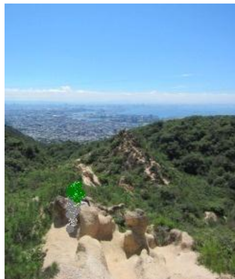
芦屋ロックガーデン